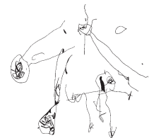
Nido Comunale "Elvise Carpi"

Sede legale: via Conciliazione, n°10-42024 Castelnovo di Sotto (RE)